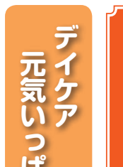
デイケア 元気いっぱい