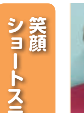
笑顔 ショートステイ