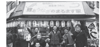
写真1—まるます家さんにて。(H28.11赤羽)