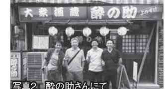
写真2 酔の助さんにて